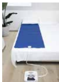
Surmatelas Canicule PVC et silicone 70 x 190 cm

Voici une offre dont vous ne pourrez plus vous passer pendant vos nuits les plus chaudes ! Le Climsom Canicule répond à une demande de plus en plus présente face aux températures de plus en plus élevées en été.