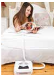
Surmatelas Canicule PVC et silicone 70 x 190 cm

Grande fraîcheur, idéal pour bien dormir pendant les nuits caniculaires. La quantité d'eau et sa matière PVC et silicone améliorent le transfert thermique et le ressenti de la fraîcheur. Réglable au degré près de 15°C à 48°C