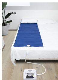
Surmatelas Canicule PVC et silicone 70 x 190 cm

Voici une offre dont vous ne pourrez plus vous passer pendant vos nuits les plus chaudes ! Le Climsom Canicule répond à une demande de plus en plus présente face aux températures de plus en plus élevées en été.