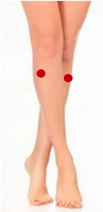
Le point Zu San Li ou Le Point magique