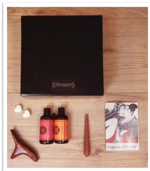
Coffret d'acupression érotique de Climsom 39,90€

Utilisée depuis des millénaires en médecine chinoise, l'acupression érotique repose sur l'interaction sur tous les plans (psychologique, sensuel, énergétique, émotionnel, spirituel) et l'harmonie entre corps et esprit.