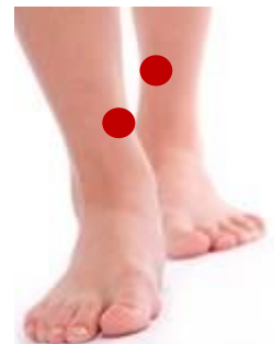
Le point San Yin Jiao ou Le Vallon suprême

Pour en savoir plus sur le coffret d'acupression érotique de Climsom : www.climsom.com