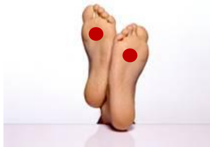
Le point Yong Quan ou La source jaillissante