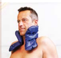
Cibler la nuque

Le coussin VolcaNuque est composé de gel, d'eau et de 8% de pierre volcanique .