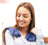
Cibler les épaules

La pierre volcanique lui confère un confort idéal et un bon maintien de la température , et permet une bonne diffusion de la chaleur ou de la fraîcheur .